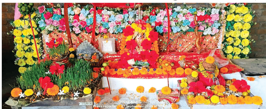
हरिभूमि न्यूज | कानड़

नवरात्रि के चलते हम ऐसी शक्ति पीठ के दर्शन करना चाहते हैं जो तंत्र साधनाओं से प्रचलित एवं मां की अद्भुत महिमा का साक्षी है। नगर में हिंगलाज देवी मठ है जिसकी प्रसिद्ध व प्राचीनता इस प्रकार है जैसे मां पितांबर पीठ नलखेड़ा की मां बगलामुखी। जिनका पहला मंदिर नेपाल में दुसरा मध्यप्रदेश के दतिया में और तीसरी आगर मालवा के नलखेड़ा में तीक इसी प्रकार मां हिंगलाज मठ भी एक ही है जो नगर के ठाकुर मोहल्ला कानड़ नगर में बरसां से विराजमान है तथा दूसरा मंदिर पाकिस्तान के बरूचिस्तान के हिंगुल नदी के नजदीक स्थित है यही इनकी प्रसिद्ध व प्राचीनता का प्रमाण है। मध्य प्रदेश के आगर मालवा जिले के विकासखंड कानड़ नगर में